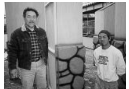
木炭塗料には防蟻・防霉・防湿・消臭の効果が あり、これからの期待は大きい